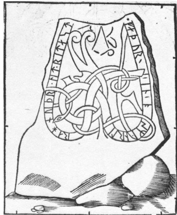
Fig. 79. U 969. Bolsta, Vaksala sn. Efter B 398.

Rhezelius, F 11: 1—8 rin·uipi , 28—37 -... m -- hau ; F a 6: 1—8 rinuipi . — B 398: 1—8 rahnuipr , 28—37 osmyrnl iu . — Celsius: 1—8 rahnuipr , 28—37 osmuitau ; om det sista anmärkes: »mörkt och blindt». — Dybeck: 1—8 rahnuipr , 28—37 o-smu-rihiu . »h i hiu har jämte sina behöriga kännestreck verkligen det i Bautil förekommande l-kännestreck. I öfrigt är hela ristningen numer mycket matt. — De två djuren, runslingans hufvud m. m., äro i Bautil dels utlemnade, dels ofullständigt återgifne.» — v. Friesen: 1—8 rahnuipr , 28—37 osmunrt hiu .