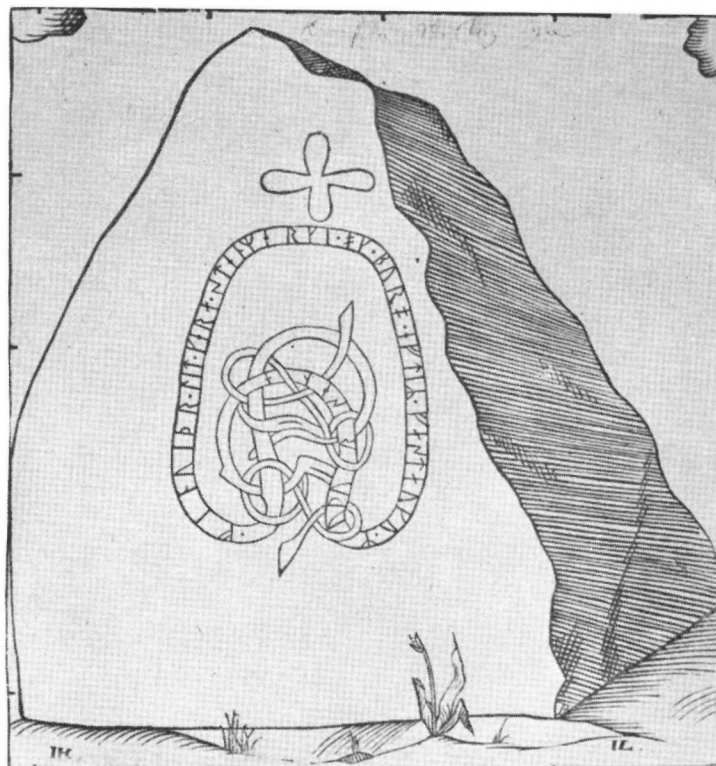
Fig. 194. U 475. Vickeby, Knivsta sn. Efter B 196.