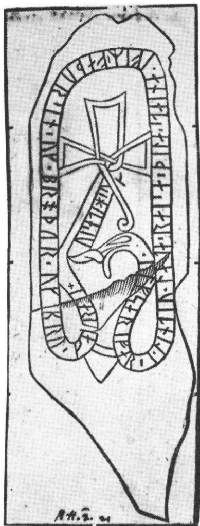
Fig. 238. U 236. Lindö, Gullbron, Vallentuna sn. Efter B 67.