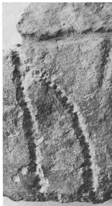
Fig. 40. Detalj av Nä 13, visande huggningstekniken. Foto N. Lagergren.

efter 13 k . Efter 10 l är ristningsytan bortslagen; av den följande runan finns inga spår. Den kan dock knappast ha varit a , ty i så fall borde, om man räknar med normalavstånd mellan runorna, den vänstra bistaven ha kunnat spåras. Det förefaller alltså som om det ord, som börjar med 10 l , har varit lit , ej t. ex. lakpi . Runföljden 11–13 auk står på det mindre stycket. 11 a , som står alldeles i fragmentets kant har förlorat huvudstavens topp och nedre del i brottkanten; genom brottet har också bistavens vänstra del gått förlorad. 12 u är helt bevarat. Bistaven utgår 1,5 cm nedanför huvudstavens topp. Runan har alltså samma form som 7 u . Mellan 12 u och 13 k finns upptill i slingan en grund, snett ned åt vänster gående linje. Tydligt har ristaren börjat runan 13 k på normalavståndet mellan runorna utan att tänka på att runslingan här svänger. Om han skulle ha fortsatt huggningen skulle staven ha träffat bistaven i 12 u . 13 k är ej stunget.